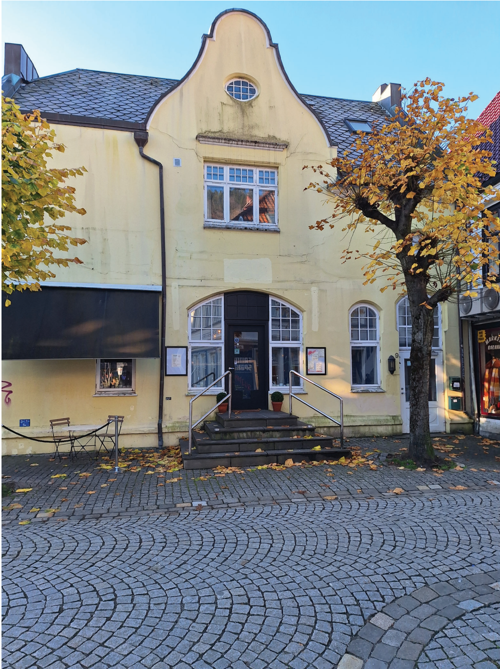
”Markens Folkebad” som nå huser restaurant Amateur