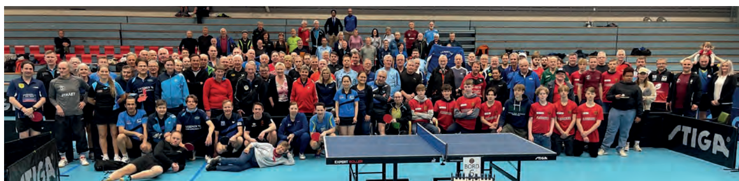
World table tennis day.